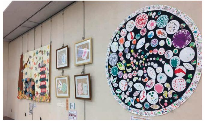
※写真は去年の作品展の様子