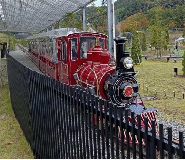
ローザン鉄道で移動もラクラク

昼食は、近江牛が入った シェフのおまかせランチ弁当 (男の子には、量が足りたかな?)